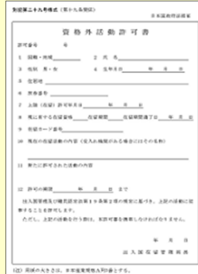
※3 資格外活動許可書