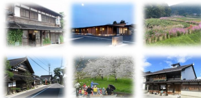
「ななお景観賞」受賞作品

お問い合わせ先 七尾市 建設部 都市建築課 都市整備・景観グループ TEL：0767-53-8469 FAX：0767-52-9288 MAIL：toshikenchiku@city.nanao.lg.jp