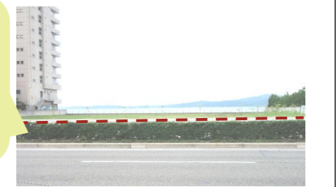
写真：ホテル海望駐車場（和倉町）