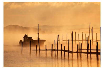
18. 朝霧の湾 牡蠣船の帰漁