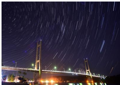
19. ツインブリッジ 夜のツインブリッジと星空