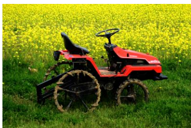
5. 春彩 地元野菜の中島菜満開