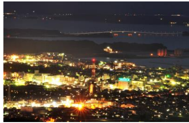
14. 夜景 市街地夜景