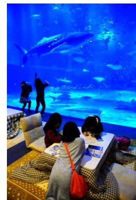
24. 冬の水族館 ジンベイザメ館冬の風物詩炬燵