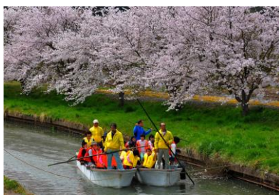
7. 春の川 日用川の花見舟