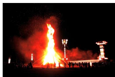
12. 火祭 能登島の火祭