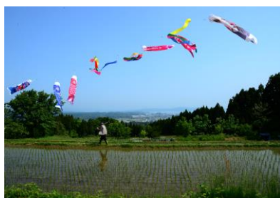
8. 棚田の春 田植え後の棚田