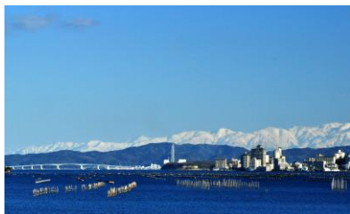
1. 早春の西湾 熊来海の背景に立山連峰