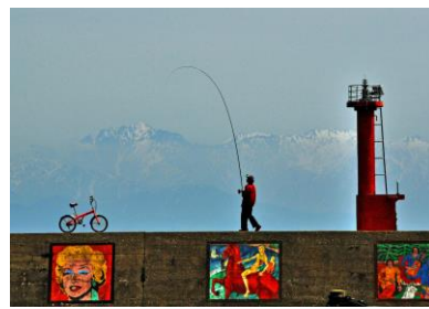
9. 釣り日和 佐々波漁港と立山連峰