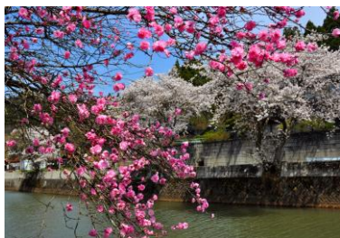
4. 春の花暦 熊木川淵の春