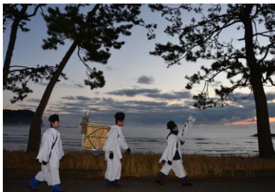
23. 鶴様道中 鶴様を気多大社へ運ぶ鶴捕部