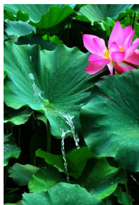
11. 翠流 里の蓮田