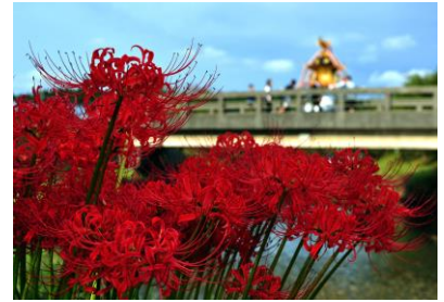
15. 彼岸の頃 満開の彼岸花