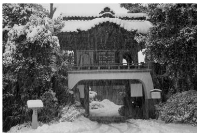
22. 雪の古寺 雪の妙観院