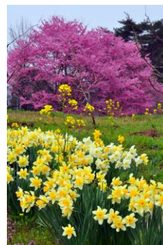
3. 春の競演 水仙と桜咲く