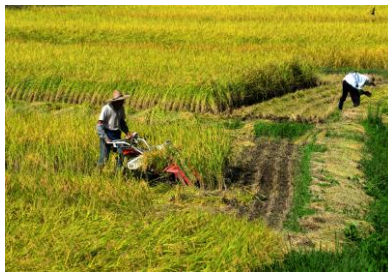
17. 実りの秋 鉾打地区での稲刈り