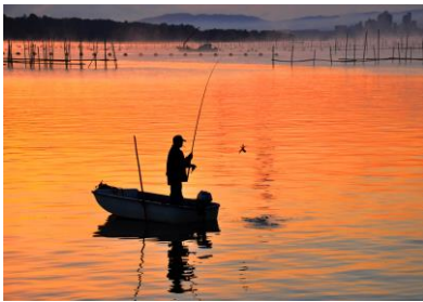
16. 湾の朝 七尾湾秋の風物詩タコ釣り