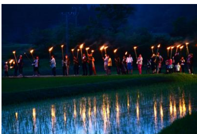
10. 虫送り 中島町各地で行われる初夏の風物詩