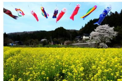
6. 薫風 中島菜と桜咲く里の春