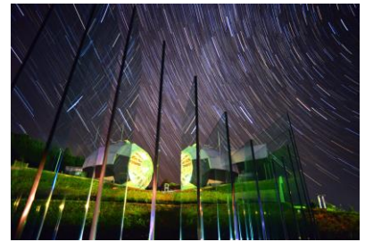
21. ガラス美術館 夜のガラス美術館と星空