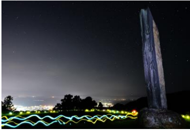
13. 城址 夜の七尾城址