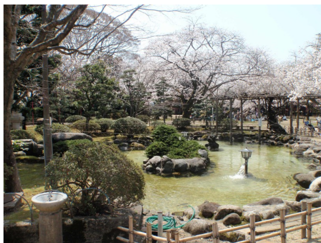
小丸山第一公園(本丸跡)

ご意見は、ご意見箱に備え付けの用紙又は、ホームページからダウンロードしてご記入下さい。ご意見箱は市役所1F情報公開コーナー、ミナ・クル2F福祉課前、各市民センターに設置してあります。(募集期間 平成26年1月17日まで)