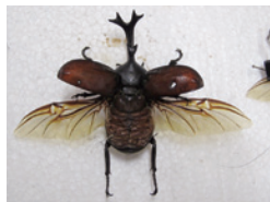
カブトムシの標本

少年科学館で長年収集されてきた生物標本を展示し、自然科学の基礎となる「標本」とは一体何なのか、どのように作られ活用されているのかなどについて解説します。