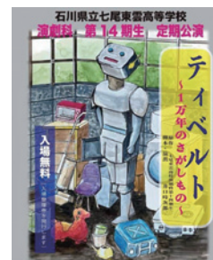
石川県立七尾東雲高等学校 演劇科 第14期生 定期公演 2023年6月16日(金)~17日(土) 能登演劇堂