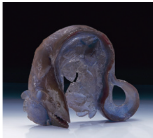
PRETTY MORAY ヤロミール・リパーク / 1998年

ガラスを溶かし固めモチーフを形作る、あるいは表面に彫刻や絵付けを施すなど、多彩な手法で作品に表現された物語を、当館の現代ガラスコレクションより52点で紹介しします。