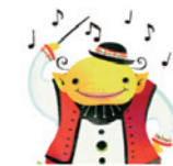
風と緑の楽都音楽祭 Gargan Music Festival

※一部小中学生の団体鑑賞の座席があります。 ※感染症対策にご協力をお願いします。