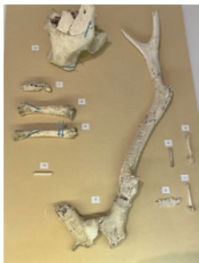
動物の骨(赤浦遺跡出土)

里山里海の恵みを味わい楽しむ七尾の食のルーツについて、縄文時代から近現代までの資料を読み解きながら紹介します。