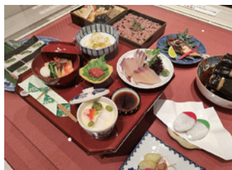
青柏祭の祭ごっつお (レプリカ)