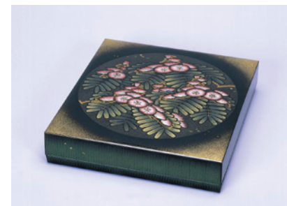
漆工「沈金象嵌合歡図色紙箱」 山岸一男作