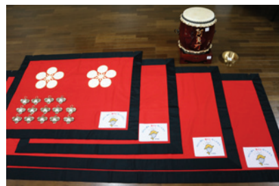
阿良町 祭り用具の整備