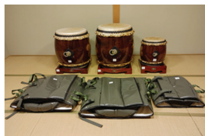
石崎町東一区 太鼓の整備