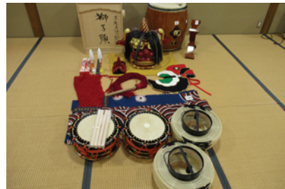
万行町 祭り用具の整備

今年度採択を受けた万行町、阿良町、石崎町東一区の町会が宝くじの助成金で祭り用具や太鼓を整備しました。