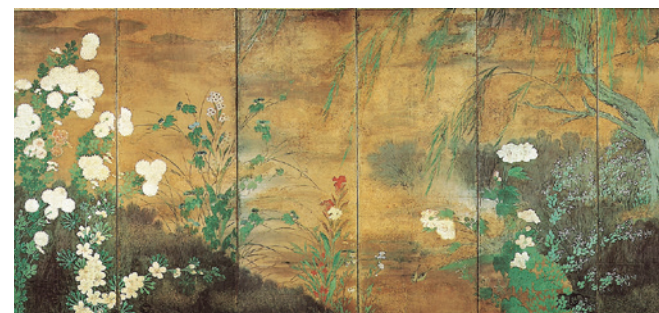
「四季花鳥図屏風」(左隻) 長谷川等伯筆 個人蔵