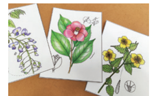
ポストカード(見本)