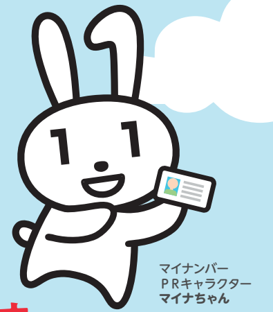
マイナンバー PRキャラクター マイナちゃん

マイナンバーカードは、本人確認のための身分証明書としてはもちろん、その他のさまざまなサービスにも利用できる便利なカードです。今後も運転免許証との一体化が検討されるなど、マイナンバーカード1枚でできることが増えていきます。