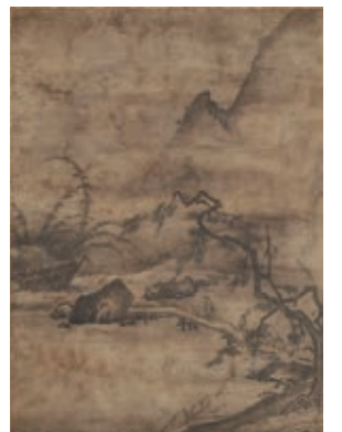
七尾市指定文化財「山水図」 長谷川信春(等伯) 石川県七尾美術館蔵

当館所蔵品から、2テーマで計73点の作品を紹介している本展。「お茶のお道具」では池田コレクションを中心に茶道美術品など43点、「花咲く美術」では花にちなんだ絵画や工芸作品など30点を展示しています。会期も残すところあとわずかです。くれぐれもお見逃しなく。