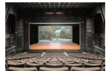
大扉が開いた舞台の様子

※公演日・貸館日・準備期間や点検期間などの劇場使用時、休館日は見学できません。 ※天候などの理由により、舞台奥の大扉は開けない場合があります。