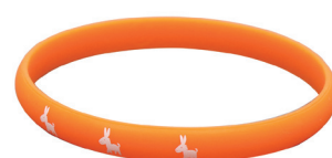
オレンジリングは養成講座を修了した証です