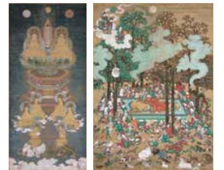
重要文化財 「釈迦多宝如来像」 長谷川信春(等伯)筆 高岡市・大法寺蔵

七尾出身で桃山時代に大活躍した画家・長谷川等伯(1539～1610)。開館25周年記念となる本展では、等伯の「能登時代」に注目。等伯が若年期に制作した仏画を中心に、無分や宗清、久蔵や等誉といった地元ゆかりの「長谷川派」絵師の作品や資料などを加え、計42点を紹介します。