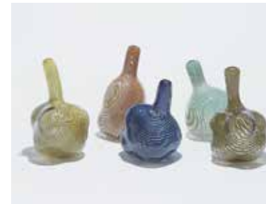
スウェリング・ボトル/志賀英二/2001年

のと里山里海ミュージアム Noto Satoyama Satoumi Museum