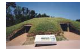
国指定史跡・須賀野古墳(能登島須賀町)

●地域学講座「歴史を学ぶ① 史料を読む」 地域の歴史を記録する古文書などの史料。初回は史料の分類法を学びます。 日時：4月18日(土)13:30～15:00 参加費無料、申し込み不要、筆記用具(鉛筆)とマスク要持参