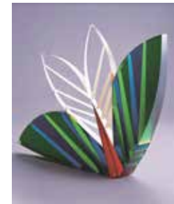
キス/パヴェル・フラヴァ 1999年