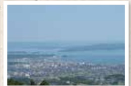
本丸から一望できる七尾湾