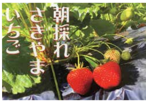
廃校を利用して無農薬で栽培したイチゴ