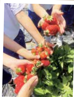
採れたての崎山いちご

「地域おこし協力隊」制度は、都市部から過疎地域などへ移住し市から委嘱された人が、住民と協働して地域課題の解決に取り組むことです。