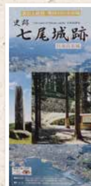
パンフレットの表紙