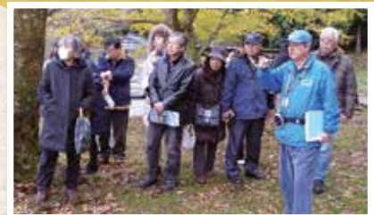
観光客を案内する観光ボランティアガイド