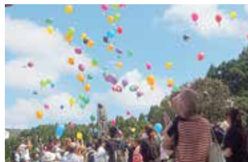
第74回七尾城まつり。住民有志が多様なイベントを繰り広げ、城山のにぎわいを生み出してきた。