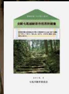
史跡七尾城跡保存活用計画書は市ホームページで閲覧できます。