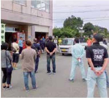
本丸駐車場までしか車は乗り入れられず、会場の設営は大変な作業。メンバーの結束力が欠かせない。

青壮年会協議会は公民館（現まちづくり協議会）が行っている清掃活動への協力のほか、毎年9月中旬に開催している七尾城まつりでは主力となって企画や運営を行っています。七尾城まつりは昭和17年から住民有志が受け継いできた伝統ある祭りです。地域住民が城山への愛着を深める機会になるようにと、本丸付近を主会場に大人から子どもまで楽しめるイベントを開催しています。ここ数年は悪天候のため城山体育館での開催となりましたが、お年寄りや小さな子どもがたくさん訪れ、展示ブースも多く設営できるなど「城下町のにぎわいを再現するまつり」という新たな構想が芽生えるきっかけとなりました。時代の流れやニーズに合わせて内容を少しずつ変えながら、より多くの人が城山に訪れる機会を作っていければと思います。