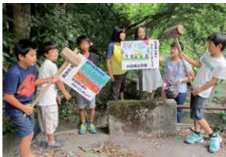
2年前の8月11日(山の日)には、ごみの多いところに児童が描いたポスターを使った看板を設置した。