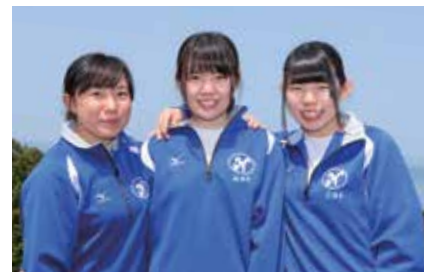
遊歩道の木製チップ散布に参加

初めて七尾城跡を訪れましたが、登山中に山の隙間から見える市街地がとてもきれいで、自然の豊かさも楽しみながら登りました。木製のチップは香りが良く、散布することで歩きやすくなるので、たくさんの人に訪れてほしいと思います。そして七尾城跡の素晴らしさがもっと広まることで、地域の皆さんの力になればうれしいです。