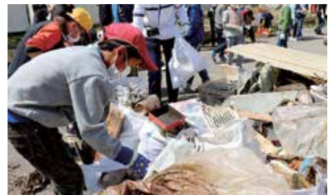
分別作業に汗を流す5年生。腐臭や舞い上がる砂ぼこりにも臆せず作業に当たる。