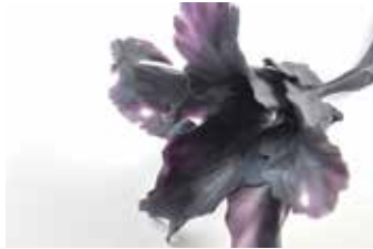
「深い静寂 2015」(部分) 小曾川曜那、2015年、作家蔵