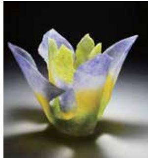
「ジャーマンアイリス」 西悦子、2016年、作家蔵