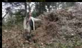
イノシシによる被害（西の丸）

一方で、将来に向けて保存や活用をしていく上では、さまざまな課題を抱えています。地震や大雨などの自然災害で石垣が崩れる被害や野生動物（イノシシ）による被害がたびたび発生し、遺構の保存に影響を及ぼしています。また、城下の遺構が地域住民の生活圏に及ぶこともあり、インフラ整備などに伴う開発行為の影響で、地形が徐々に変化し遺構が失われつつあります。そのほか、山林の荒廃やごみの不法投棄により、七尾城跡の魅力の1つである本丸からの眺望や山林の景観保全にも影響が出ています。