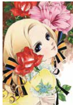
「銀のかげろう」 ©牧美也子