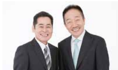
中田カウス・ボタン

中田カウス・ボタンが発起人となり「よしもとが生んだ最高の宝」漫才の魅力をもっと多くの人に知ってもらおうと立ち上げた全国ツアー「漫才のDENDO」。よしもとの漫才師たちが、七尾に“生”の漫才を届けます。お楽しみに！