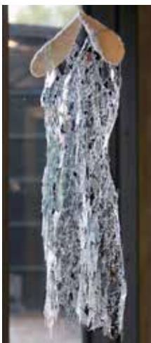
「Contradiction in daily life」 言上典典、2008年、作家蔵