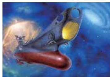
「宇宙戦艦ヤマト」©松本零士

当館初の漫画、アニメ関連展覧会。メーテルやキャプテンハーロックに、少女漫画『りぼん』連載の「銀のかげろう」「マキの口笛」の主人公たちが、皆さんを待っています。牧氏監修の初代のリカちゃん人形も展示。また、観覧者全員に二人のポストカードをプレゼント！ぬりえやなりきりフォトコーナーも楽しめます♪