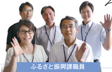
ふるさと振興課職員