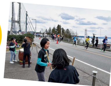
長浦うるおい公園 (ツインブリッジ横)