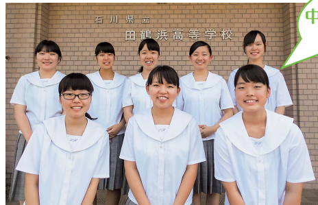
中部ブロック代表で 頑張ります!

●田鶴浜高等学校 手話部 私たちは、第3回手話パフォーマンス甲子園の出場に向けて一生懸命練習しています。学校の仲間だけではなく、七尾市手話サークルの皆さんや地域の皆さんとの交流も本当に楽しく、皆さんに応援して頂けていることが私たちの喜びです。これからも、応援よろしくお願いします。