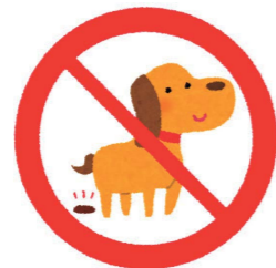
ペットのふんの放置