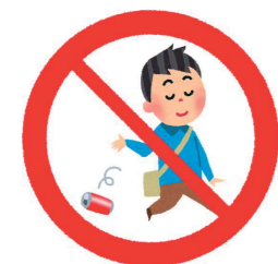
空き缶などのぼい捨て