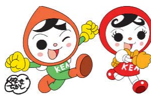
「人権イメージキャラクター」 人KENまるもる君 人KENあゆみちゃん