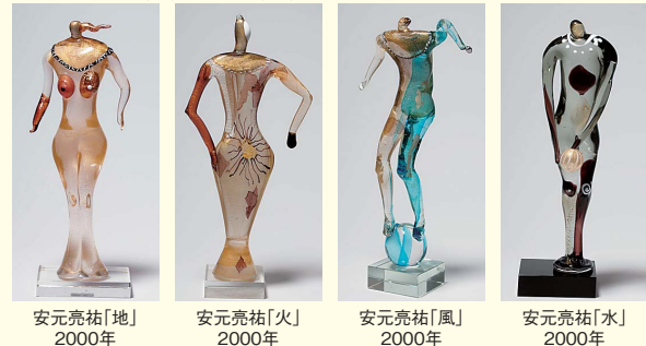
安元亮祐「地」2000年 安元亮祐「火」2000年 安元亮祐「風」2000年 安元亮祐「水」2000年

■会期 11月24日(日)まで ■休館日 11月19日(火) ■開館時間 9:00～17:00(入館は16:30まで) ■入館料 一般800円 中学生以下無料 ※11月25日(月)～29日(金)は展示替え期間のため、休館します。