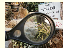
花の大きさは2ミリ ショウノキス属ジェンマタ