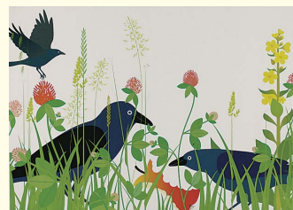
「自然の中にあるおもちゃ」 アンヌ・クロサ(スイス)