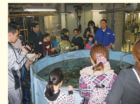
魚たちの飼育に挑戦!