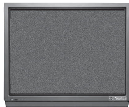
【アナログ放送終了後】