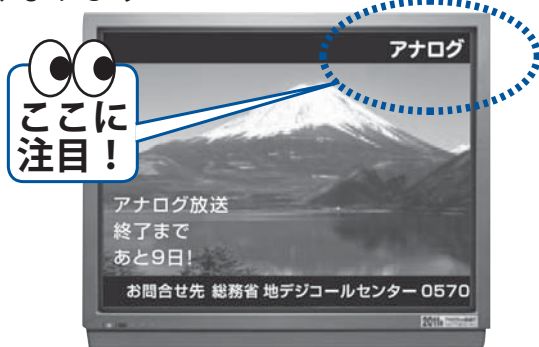
【今、見ているテレビ】

テレビの画面に「アナログ」と表示されている場合！今のままではテレビが見られなくなります！