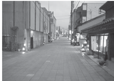
一本杉通り街路灯(一本杉町)