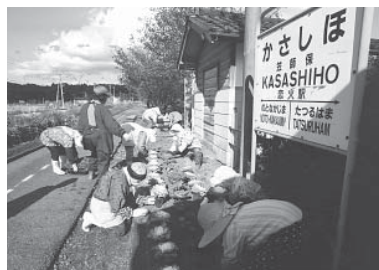
笠師保駅(中島町笠師)