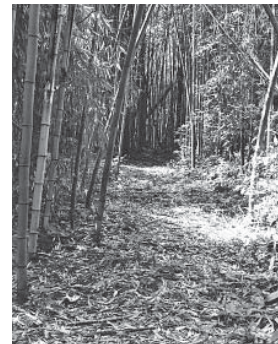
じじ・ばばの歩いた道 (能登島向田町)