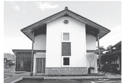
室木歯科口腔外科医院(中島町浜田)