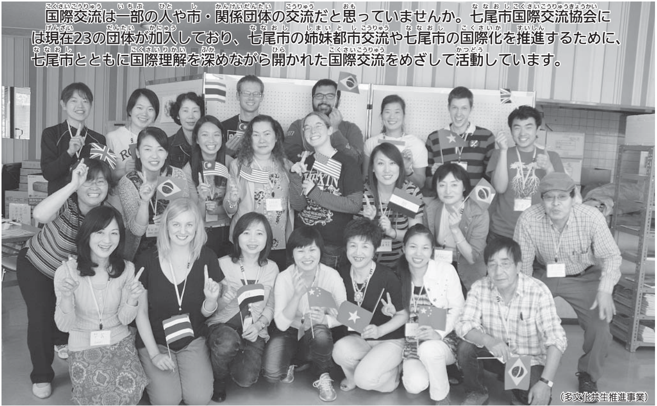
(多文化共生推進事業)

国際交流は一部の人や市・関係団体の交流だと思っ ていませんか。七尾市国際交流協会に は現在23の団体が加入しており、七尾市の姉妹都市交流や七尾市の国際化を推進するために、 七尾市とともに国際理解を深めながら開かれた国際交流をめざして活動しています。