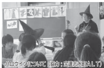
ハロウィンについて (協力：宝達志水町ALT)