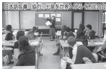
日本語指導 (協力：七尾を世界へひろく市民の会)