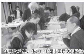
年賀状づくり (協力：七尾市国際交流協会)