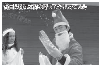
各国の料理を持ち寄ってクリスマス会