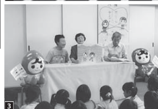
1 人権相談 2 人権啓発街頭キャンペーン 3 人権教室 4 人権擁護委員の皆さん