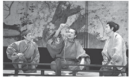
能登演劇堂で行われた「等伯公演」