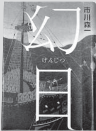
「幻日」 市川 森一 講談社