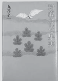
「樹液そして果実」 丸谷 才一 集英社