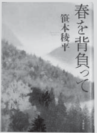
「春を背負って」 笹本 稜平 文藝春秋