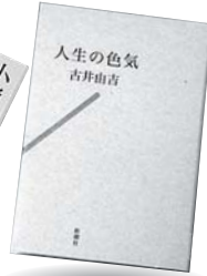
『人生の色気』 古井 由吉 新潮社

戦後という時代の節目節目で作家は何を考え、何を書こうとしたのか。作家生活50年の自作を語る3部作。