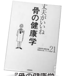
『骨の健康学 (丈夫がいいね21)』 北國新聞社編 北國新聞社

夕顔はなぜ、それほどまでに魅力的な女性なのか？源氏物語をひも解きその秘密を明らかにする。