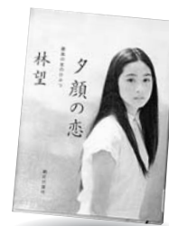
『夕顔の恋』 林 望 朝日新聞社

七分の真面目と、三分の気まま、僕はこうして生きてきた。焼美(しょうい)弾が降る東京から、昭和の高度成長、あの世とこの世の仲立ちまで、文学の達人が自在に語る。