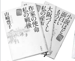
『山崎豊子 作家の使命 私戦後』 ①～③』 山崎 豊子 新潮社

戦後という時代の節目節目で作家は何を考え、何を書こうとしたのか。作家生活50年の自作を語る3部作。