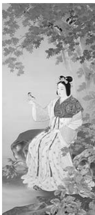
「龍田姫之図」紺谷光俊 石川県立美術館蔵