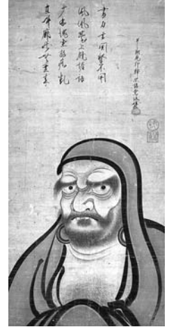
「達磨図」 長谷川左近筆 個人蔵