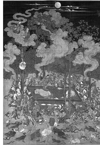
七尾市指定文化財「湿原図」 無分筆 七尾市・長壽寺蔵