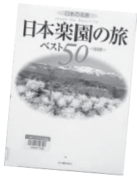
『日本楽園の旅 ベスト50』 渋川 育由 河出書房新社