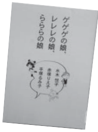
『ゲゲゲの娘、レレレ の娘、らららの娘』 水木悦子/赤塚りえ子/手塚るみ子 文藝春秋