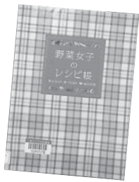
『野菜女子の レシピ集』 枝元 なほみ他 家の光協会