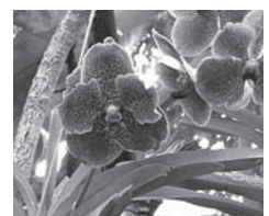
ランには珍しい青色のバンダ