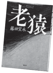
老猿 藤田 宜永 講談社