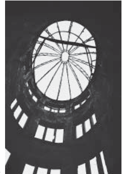
「原爆ドーム」昭和32年