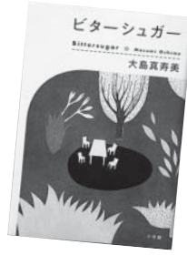
ビターシュガー 大島真寿美 小学館