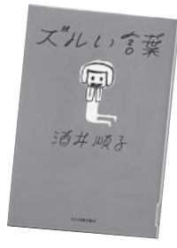
ズルい言葉 酒井 順子 角川春樹事務所