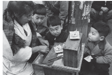
「しんご細工 東京・浅草雷門」昭和29年