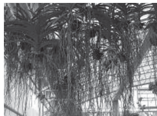
根がさらされた状態のバンダ (蘭遊館内)