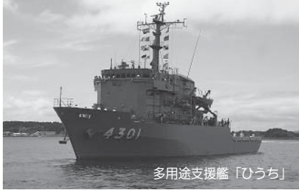
多用途支援艦「ひうち」