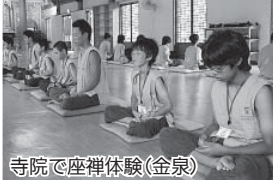
寺院で座禅体験(金泉)