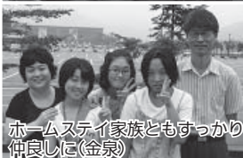
ホームステイ家族ともすっかり仲良しに(金泉)