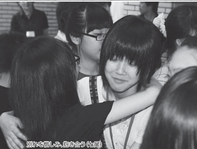
別れを惜しみ、抱き合う(七尾)