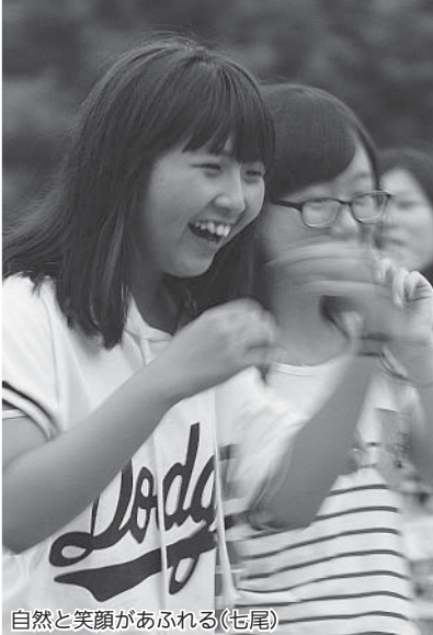
自然と笑顔があふれる(七尾)