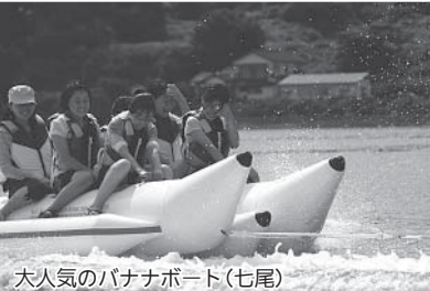
大人気のパナナボート(七尾)