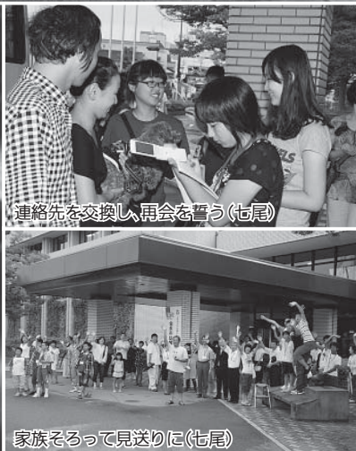
連絡先を交換し、再会を誓う(七尾)