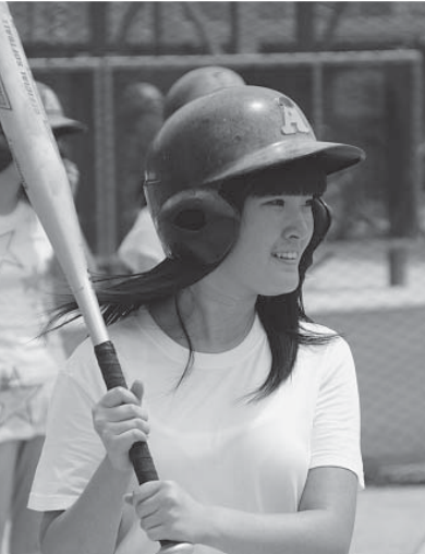
朝日中学校で初めての部活動体験(七尾)