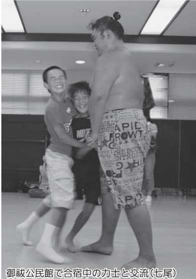
御蔵公民館で合宿中の力士と交流(七尾)