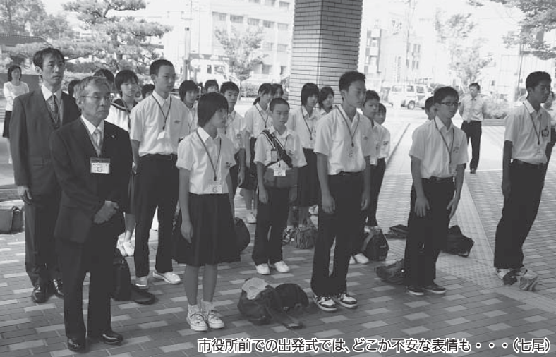
市役所前での出発式では、どこか不安な表情も・・・(七尾)