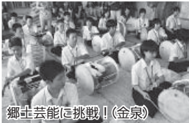
郷土芸能に挑戦!(金泉)