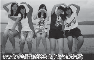
いつまでも「愛」が続きますように(七尾)