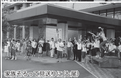
家族そろって見送りに(七尾)

この夏、海を越えて新たな交流の輪が生まれた。七尾市と姉妹都市提携を結ぶ韓国金泉市との中学生相互派遣交流(＝七尾市金泉市中学生交流。以下、「中学生交流」)だ。昨年、「韓国金泉市市長が訪問した際に、中学生交流が相互から提案され実現に至った。昭和50年に姉妹都市提携をして以来初の出来事だ。交流を通して国際的な視野を広げ、これからの未来を担う青少年を育成することが目的。 今回の中学生交流に参加したのは、市内の中学校から集まった中学1年から3年までの男女あわせて20人。7月26日から30日まで金泉市を訪問。8月9日から13日まで、金泉市から訪れた中学生20人を七尾で受け入れた。 交流事業を通して中学生が得たものとは何か。参加した中学生とそれにかかわった多くの方々の声から、『交流体感都市』を掲げる七尾市の将来像を考えてみたいと思います。