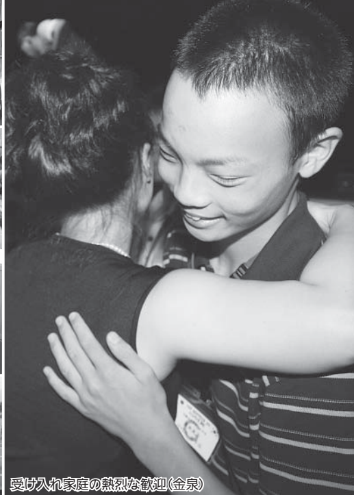
受け入れ家庭の熱烈な歓迎(金泉)