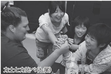
力士と力比べ(七尾)