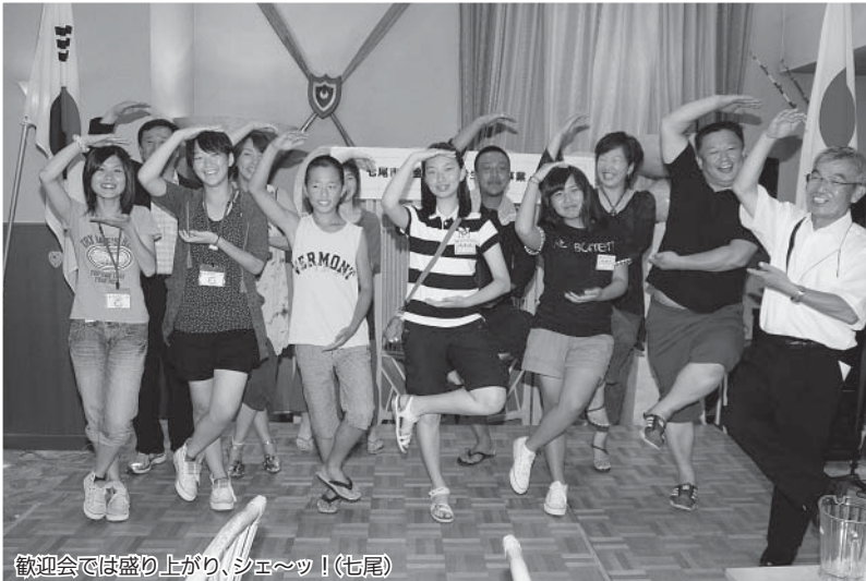
歓迎会では盛り上がり、シェ〜ッ!(七尾)