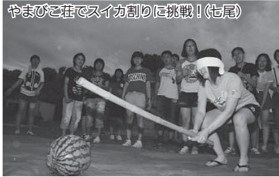
やまびこ荘でスイカ割りに挑戦!(七尾)