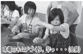
本町のキムチづくり。辛っ・・・(金泉)