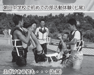
ふざけあう姿も・・・(七尾)