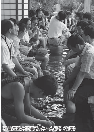
和倉温泉の足湯での〜んびり(七尾)