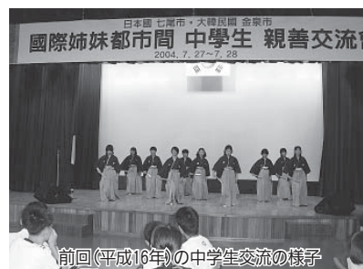
前回(平成16年)の中学生交流の様子