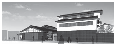
和倉温泉総湯完成イメージ図