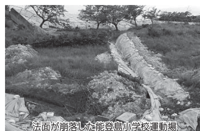
法面が崩落した能登島小学校運動場