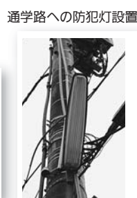
通学路への防犯灯設置