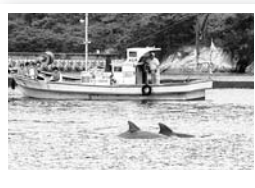
里海を活用した滞在型観光を推進