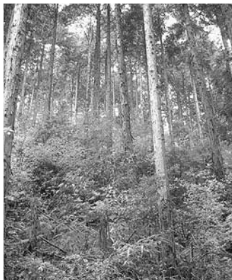
(写真2) 間伐を適正に行った森林