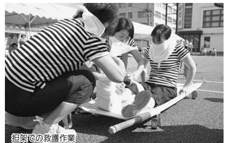
担架での救護作業