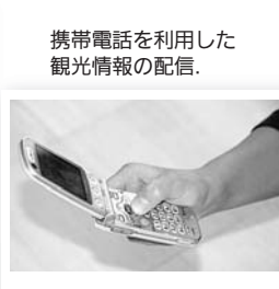
携帯電話を利用した観光情報の配信。