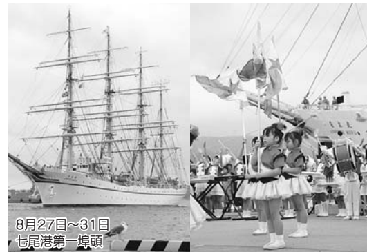
8月27日〜31日 七尾港第一埠頭

七尾港開港110周年記念事業の一環で、帆船日本丸が七尾港に寄港した。5日間の停泊中に、操帆訓練(セイルドリル)、一般公開、登しょう礼など見物客を大いに賑わせてくれた。出港では、七尾みなと保育園と東みなと保育園の園児によるマーチング演奏で出港を祝った。