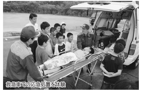
救急車での応急処置を体験