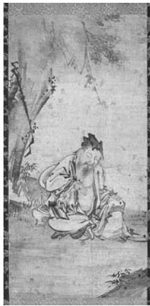
絵画「陳希手鑑図」長谷川信春(室町)

一般350円(280円)・大高生280円(220円) ※中学生以下無料・( )は20名以上の団体料金