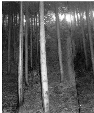
(写真1) 間伐が行われていない森林

一方、適正に管理された森林は明るく、下草が繁茂し、木一本一本がしっかりと成長しているため、土壌の浸食や流出が抑えられています(写真2)。