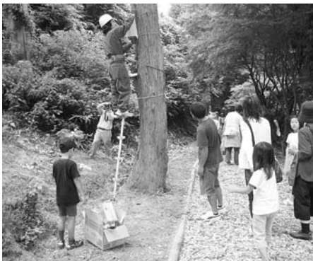
平成20年9月に行われた「子ども森の恵み推進事業」による巣箱設置(古城町地内)

② 県民の理解と参加による森づくりの推進 とともに良質な水を育み、きれいな空気や安らぎの空間を提供するなど、さまざまな恵みを与えてくれることを高めるための手入れ不足人工林の整備