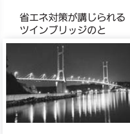
省エネ対策が講じられるツインブリッジのと