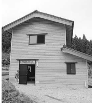
(写真：H21コミュニティセンター助成事業により建設された湯川町多目的コミュニティセンター)