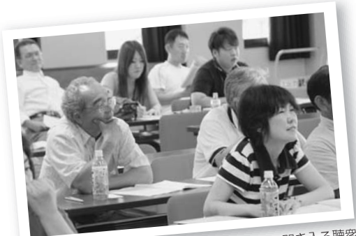
興味深く提案に聞き入る聴衆