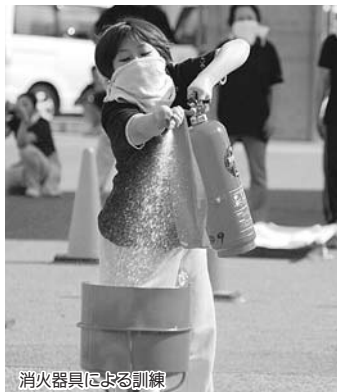
消火器具による訓練