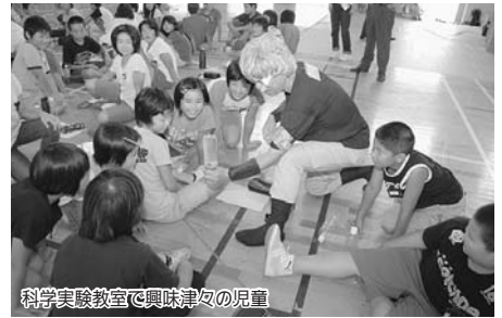
科学実験教室で興味津々の児童

平成19年3月25日に起きた能登半島地震を教訓に、石川県は今年の夏休み期間中、小学校高学年の児童を対象に、体験型の防災教室を開き、七尾市では能登島小学校で行われた。1泊2日の日程で避難生活を疑似体験するため学校の体育館に宿泊し、アルファ米やパンの缶詰などの災害非常食を試食した。また、煙が充満した場所からの避難や消火器の取り扱い、救護活動の体験など、実践的なプログラムを通じて身をもって災害への備えを学んだ。児童は、初めて見るものや体験するものにも楽しみながらも、災害時の備えの重要性を認識していた様子。