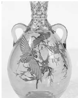
「昆虫文双耳花器」エミール・ガレ 1880年代 北海道立近代美術館所蔵

ガラス芸術のエッセンスを贅沢に詰め込んだ珠玉の展覧会! 見るほどに奥深いガラス芸術の魅力をご覧ください。