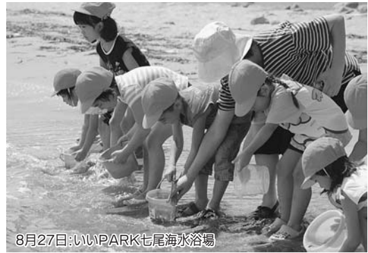
8月27日:いいPARK七尾海水浴場

大吞保育園の園児17人が庵町の海岸で、体長3〜5浬のクロダイの稚魚1万匹を放流した。園児たちは大きな声で「大きくなってね」と願いを込めた。最近、子どもたちの魚離れが進んでいることもあり、地域の水産資源に興味をもってもらおうと企画された。