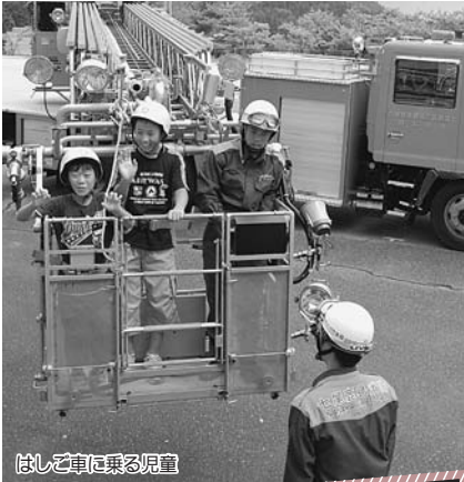
はしご車に乗る児童