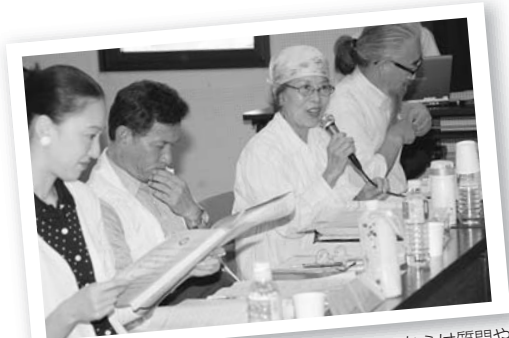
熱のこもった提案に、選考委員からは質問や活動へのアドバイスがおくられた。