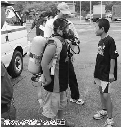
ガスマスクを付けてみる児童