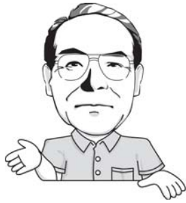
七尾市長 武元 文平

七尾市民には肥満(メタボ)の人が多く、生活習慣病(糖尿病、高血圧症など)が増えています。小中学生の肥満児も多く、成人病予防の面でも問題です。ご飯よりスナック菓子や清涼飲料で食事を済まし、朝食をとらない子どもが肥満になるよう