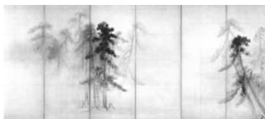
洞爺湖サミット会場を飾った等伯筆 国宝「松林図屏風」の複製

★等伯の心象風景とも能登の原風景ともいわれる国宝「松林図屏風」。国宝の人気アンケートで第1位に輝いた名作で、平成17年に七尾美術館で特別公開を果たしました。