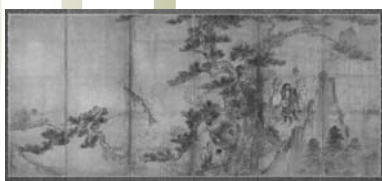
重文「列仙図屏風」長谷川等伯 京都市・壬生寺蔵