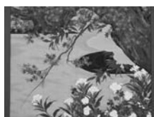
上:等伯長男久蔵筆「桜図」前懸 下:等伯筆「楓図」後懸