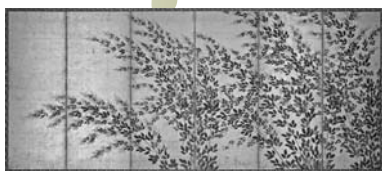
「萩芒図屏風」長谷川等伯 出光美術館蔵