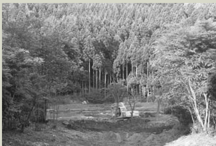
重機を使った作業で広がった演劇堂裏。この無限の空間がどのように活かされるのかに注目!

物語の舞台となるスコットランドの荒野を再現するために、舞台裏に生い茂る木々を別の場所に植え替えるという大がかりな作業からも、この場面が見どころとなることろがうかがえる。