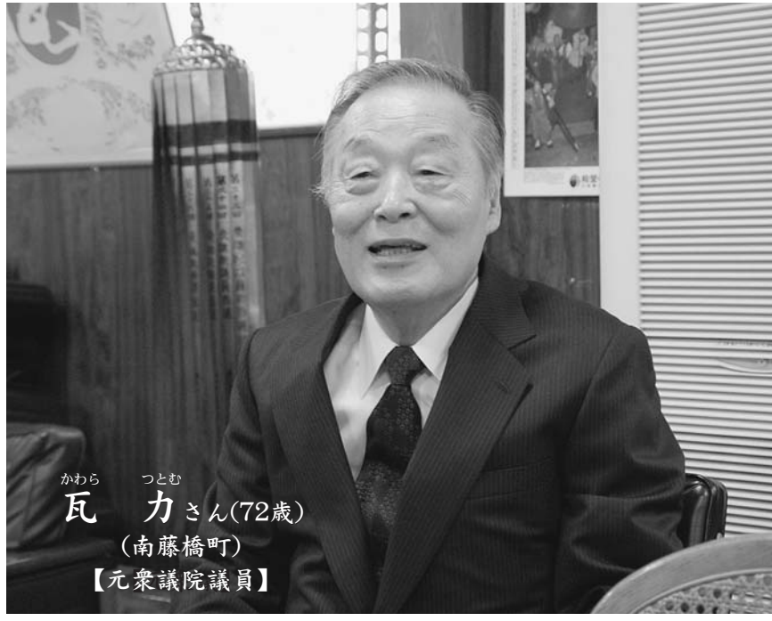
かわら つとむ 瓦 力 さん(72歳) (南藤橋町) 【元衆議院議員】