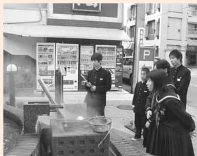
市内見学:和倉温泉では、温泉たまごを作ることができる場所を発見!