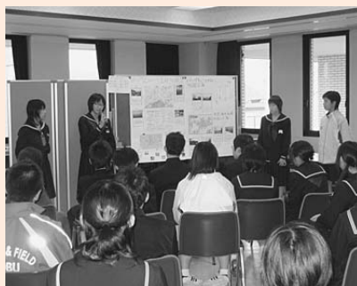
発表:市内見学で発見したことをまとめ、今まで知らなかった七尾に「へっ!」

市内見学で発見したものを地域図の中に整理し、まちの姿を明らかにしました。グループごとに、より良い「まち」のあり方を図にまとめ、その結果を各班で話し合い、発表しました。