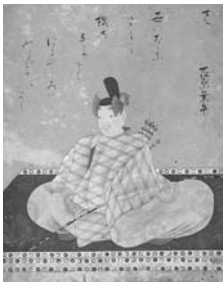
七尾市指定文化財 絵画「総社三十六歌仙図頌」 (部分) 七尾市古府町会蔵