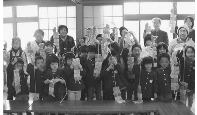
昨年のかきもち作り。こんなに上手にできたよ!【北大呑児童館】