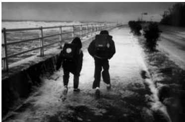
写真「冬の道」 齊田正一 当館蔵