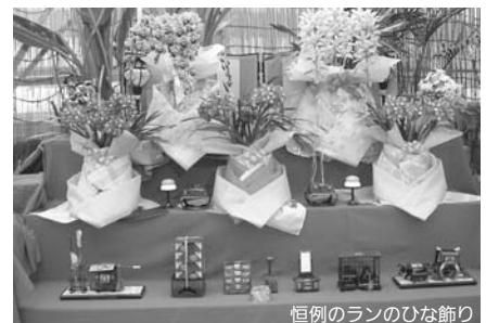
恒例のランのひな飾り