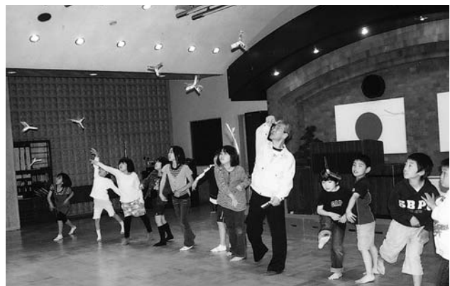
『作って遊ぼう、ブーメラン』 ～うまくキャッチできるかな～

※詳細については、あい・あい・あい日よりや 七尾市ホームページをご 覧ください。