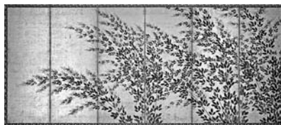
「秋芒図屏風」(右隻)長谷川等伯 京都市・相国寺

平成22年は七尾生まれの画家・長谷川等伯の没後400年です。本展ではその前年祭として七尾初公開作品を中心に14点を紹介、国宝「松林図屏風」の複製や、国宝「楓図」を綴れ織りで表現した祇園祭浄妙山懸装品なども特別展示しますので、お楽しみに!