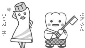
日本歯科医師会PRキャラクター