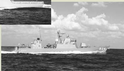
ミサイル艇「うみたか」