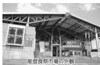
能登食祭市場の外観