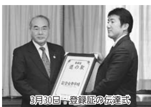
3月30日、登録証の伝達式

なお「能登食祭市場」は、港の施設、空間、景観を地域住民や来訪者の憩いの場として活用して地域に賑わいを創出し、地域活性化に寄与することを目指す場所として、「みなとオアシス」にも登録されています。全国に約40カ所ある「みなとオアシス」のなかで、数少ない「道の駅」とのダブル登録となり、海と陸の玄関口として多くの観光客を見込んでいます。