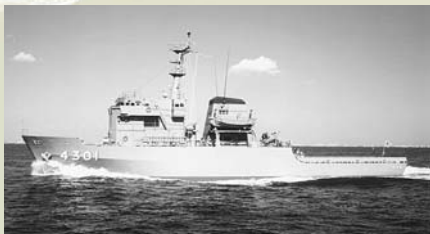
多用途支援艦「ひうち」