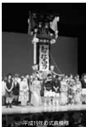
平成19年の式典模様