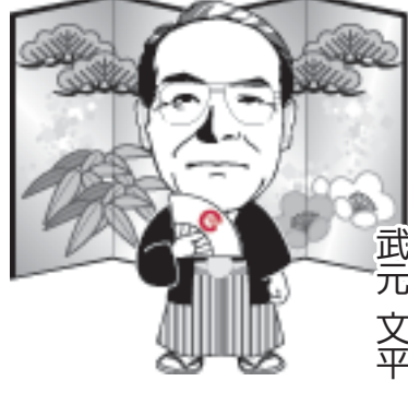
七尾市長 武元 文平