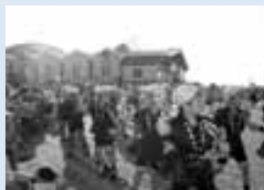
チビッコカーニバル