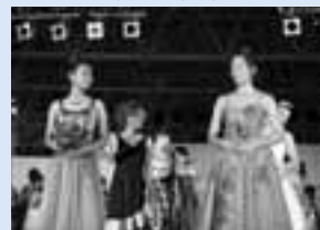
海が見えるファッションショー