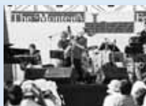
モンレージャズフェスティバル