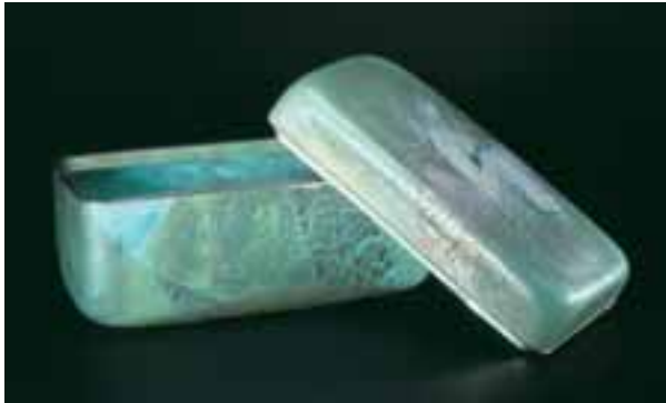
飾筒「菖蒲」/1973年/東京国立近代美術館所蔵

ガラス界で初の文化勲章を受章した日本を代表する世界的なガラス作家・藤田喬平(1921 - 2004年)の大回顧展を開催します。色ガラスに箔を散りばめた飾筒の連作をはじめ、イタリアのヴェニスで制作したオブジェなど約150点の作品とともに藤田氏の40年間の足跡をたどります。