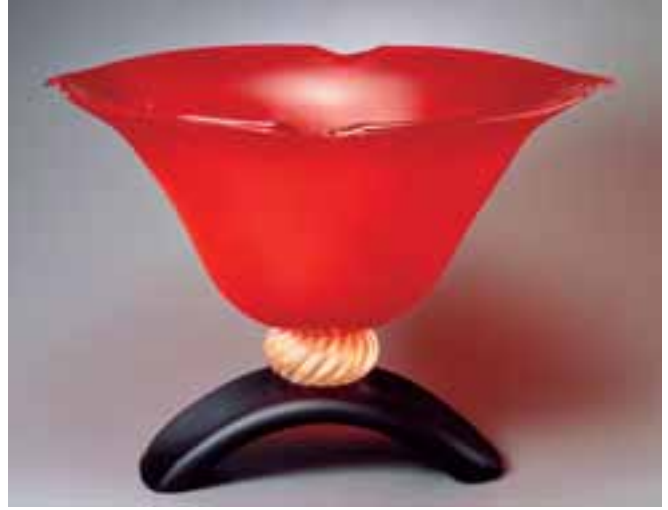
花開く/1995年/黄金崎クリスタルパーク所蔵

会 期 3月8日(土)～5月11日(日) *4月15日(火)は休館 開館時間 9:00～16:30 (入館は30分前まで) *4月からは17:00まで開館 観 覧 料 個人800円、団体700円*中学生以下無料